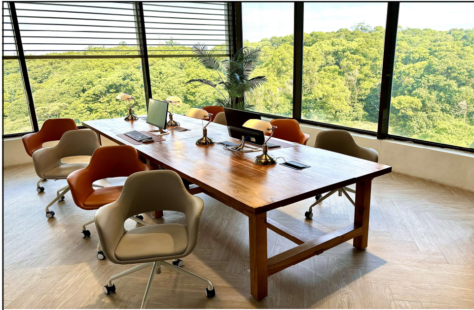
圖書館2樓「閱讀檢索區」