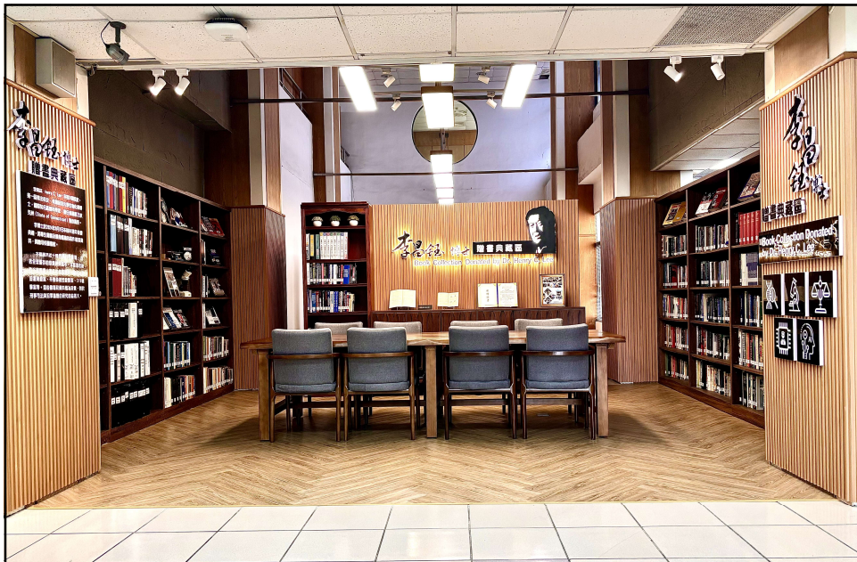
圖書館2樓「李昌鈺博士贈書典藏區」