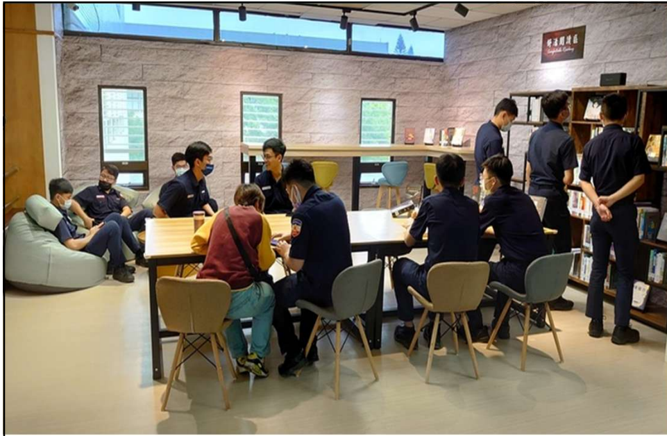
圖書館3樓「舒適閱讀區」