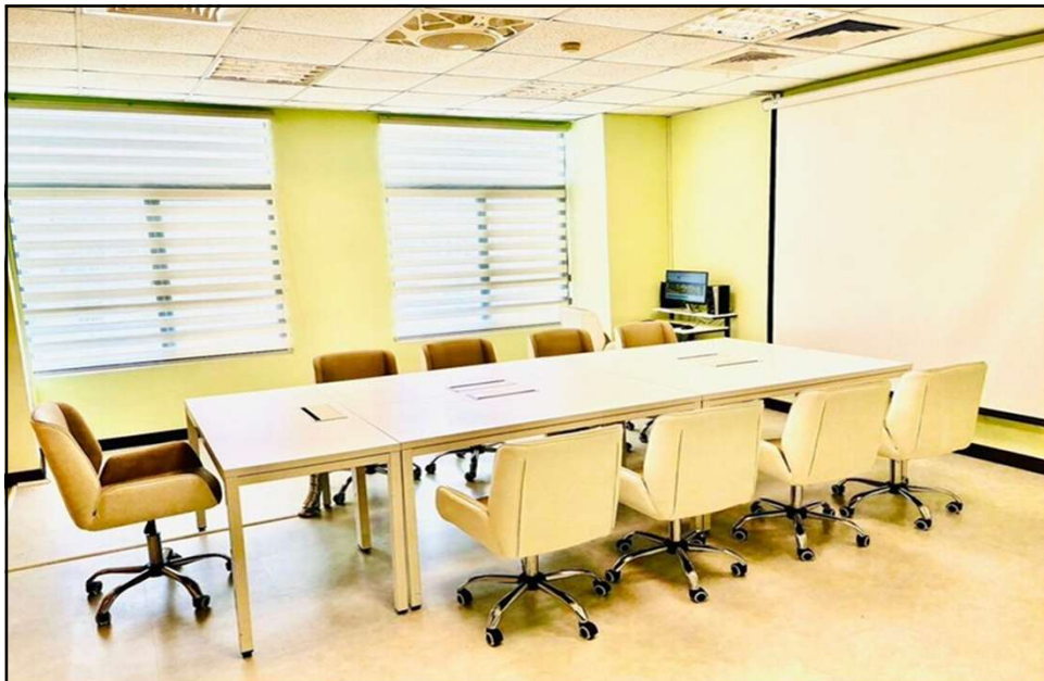
圖書館3樓「集思談」- 閱讀研討區